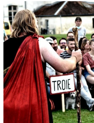
Public installé en bi-frontal : Camp des Grecs et camp des Troyens