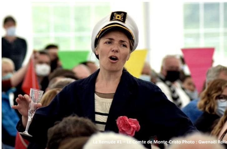
La Remuée #1 – Le Comte de Monte-Cristo

Remuée [ʁəmye] n.f. 1. (agric.): transhumance des troupeaux vers l'alpage; retour des troupeaux à la bergerie. 2. (théât.): théâtre en extérieur qui revisite les grands classiques.