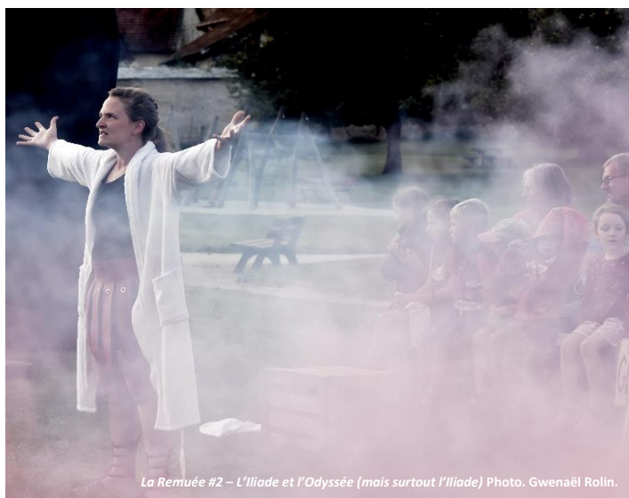
La Remuée #2 – L'Illiade et l'Odyssee (mais surtout l'Illiade)

Nous jouons en extérieur car nous sommes allergiques à la poussière, et aussi parce qu'on aime retrouver l'ambiance du théâtre de tréteaux, populaire et joyeux